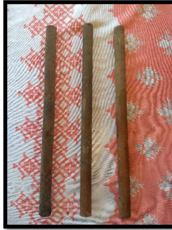
Figura 9 – Cabo cortado em partes iguais