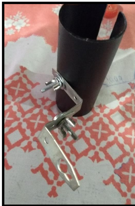
Figura 14 – Parafuse a segunda mão francesa

Junte com a outra mão francesa conforme é mostrada na imagem a seguir: