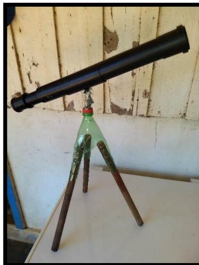
Figura 16 – Luneta finalizada

Agora só acoplar a Luneta no cano de 50mm cortado e rosquear a tampa da garrafa no suporte feito.