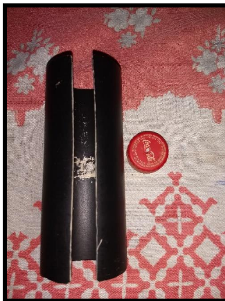
Figura 12 – O corte e os furos

Faça um corte transversal no cano de PVC de 50mm e um furo central, fure também o centro da tampa da garrafa.