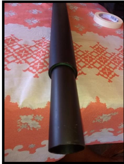
Figura 4 – Corpo da Luneta

3º Passo: Após ter posto as fitas na ponta dos canos de 50mm e 40mm, introduza o cano de 40mm dentro do cano de 50mm pelas pontas opostas que estão as fitas, com muito cuidado para não danificar a pintura interna e não desmanchar as fitas coladas nas pontas. Com isso o corpo da Luneta já está feito.