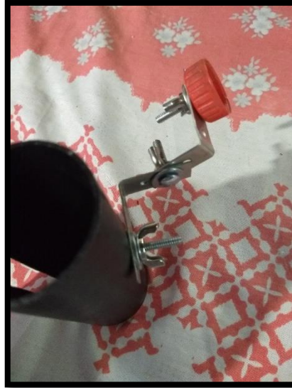
Figura 15 – Parafuse a tampa da garrafa PET

Parafuse também na tampa da garrafa PET.