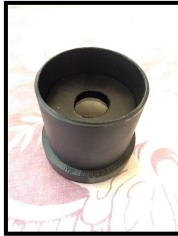
Figura 6 – Suporte da lente objetiva

5º Passo: Para o suporte da lente objetiva, utilize a luva de 50mm, coloque dentro da luva a lente objetiva com o lado convexo para o lado de fora (lado que tem uma “barriga” apontada para o céu), logo após coloque a ruela feita de cartolina preta junto com a lente.