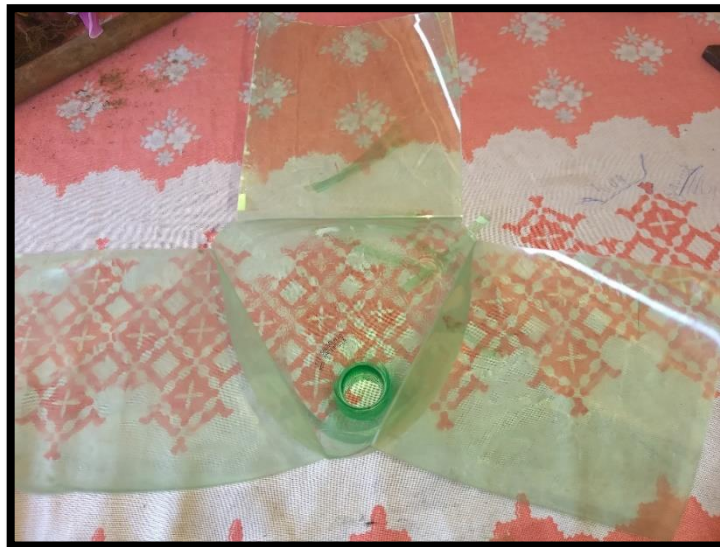
Figura 10 – Garrafa PET cortada

Corte a garrafa PET ao meio e abra a garrafa em 3 partes como a imagem abaixo: