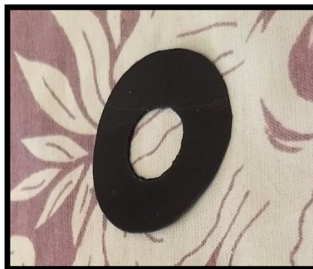
Figura 5 – Ruela de cartolina

4º Passo: Pegue a cartolina preta e usando um compasso marque a cartolina e corte uma ruela com 50mm de diâmetro pelo lado de fora e com 20mm de diâmetro pelo lado de dentro. O uso dessa ruela diminuirá a entrada de raios luminosos para dentro da Luneta.