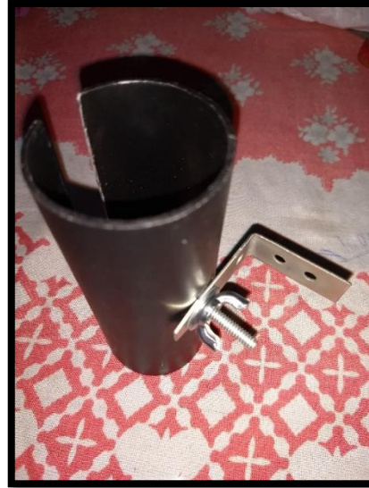
Figura 13 – Parafuse a mão francesa no cano

Passa um parafuso pelo furo do cano e em uma das mãos francesas.