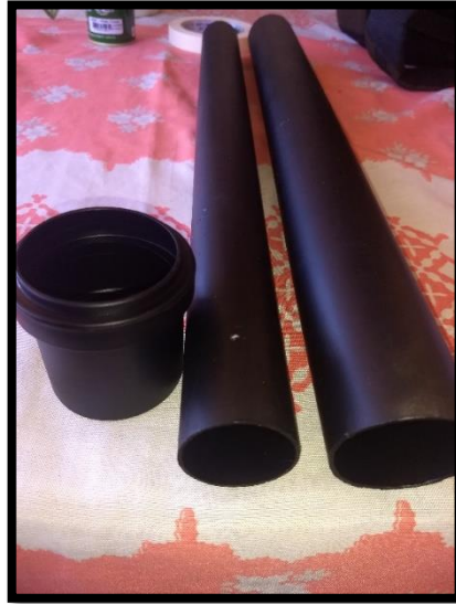
Figura 2 – Canos pintados na parte interior de preto fosco