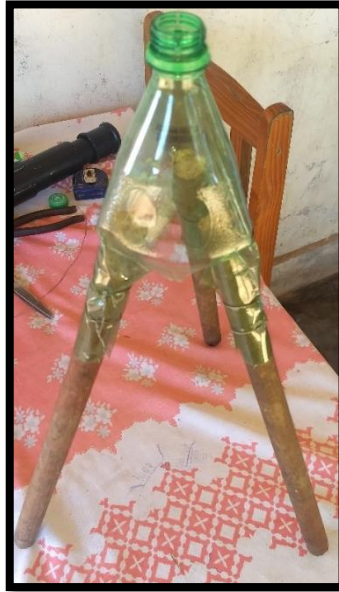
Figura 11 – Estrutura do tripé