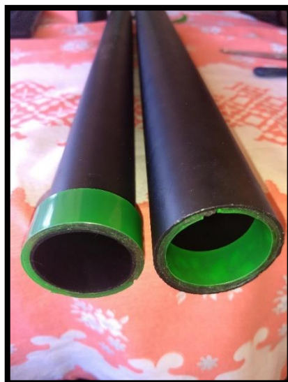
Figura 3 – 2 voltas de fita dupla face

2º Passo: Depois de pintados e bem secos, cole 3 voltas de fita dupla face em uma das pontas do cano de 50mm pelo lado de dentro. Cole também em uma das pontas do cano de 40mm pelo lado de fora. Passe a fita crepe nas extremidades da fita dupla face para não ficar grudentas. Essas fitas servirão para dar sustentação e evitar que os canos fiquem folgados um dentro do outro quando estiver pronto.