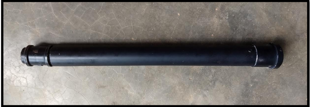
Figura 8 – Luneta montada

7º Passo: Encaixe os suportes da lente ocular e da objetiva no corpo da Luneta. A Luneta está pronta.