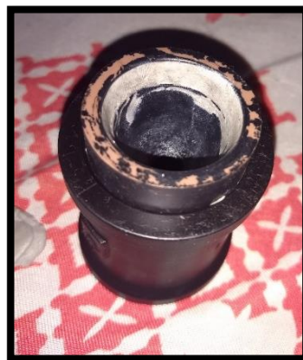
Figura 7 – Suporte da lente ocular

6º Passo: Para o suporte da lente ocular, dependente da lente usada deverá criar um suporte para encaixar no cano de 40mm, nesse caso será utilizado uma lente retirada de uma máquina fotográfica estragada. Encaixe a bucha hidráulica de 40mm x 32mm dentro da luva hidráulica de 40mm. E a lente ocular dentro da bucha hidráulica de 40mm x 32mm, passe a massa epóxi para fixar e modelar.