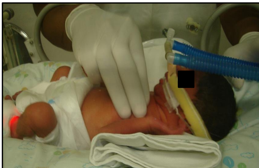
Figura 3 - Pronga Nasal

Dentre os principais cuidados destacam-se a utilização de pronga nasal de tamanho apropriado conforme demonstrado na figura 3, a mesma impede o escape de gases quando a pronga se desloca das narinas, verificação da montagem e checagem do sistema, monitorização contínua e avaliação periódica das narinas, asas, septo nasal devido à possibilidade de lesões, que incluem desde uma hiperemia tecidual, isquemia e até necrose, posicionamento do RNPT e a fixação adequada do circuito da CPAP, umidificação e aquecimento apropriado dos gases. (BONFIM et al., 2014).