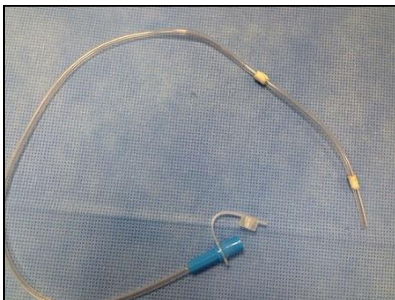
Figura 4 - Cateter arterial

Para o procedimento é necessário um cateter fino flexível de pequeno diâmetro, denominado como cateter arterial de sucção ou cateter gástrico conforme mostra a figura 4, deve ser introduzido através das cordas vocais de 1 à 2 cm de profundidade, por visualização direta da glote com um laringoscópio, para evitar a inserção profunda é realizado uma marcação nos tubos pois, a maioria dos cateteres arteriais tem marcas entre 1,0, 1,5 e 2,0 cm, sendo assim, é realizado uma marcação adicional na tubulação. Seguido da introdução do cateter fino pela traquéia, em seguida o laringoscópio é removido, a posição do cateter é assegurada pelos dedos e o surfactante é lentamente injetado entre 1 a 3 minutos. A dose de surfactante administrada consiste em 100 mg/kg, após a instilação de surfactante, o cateter é imediatamente removido. (HERTING, 2013).